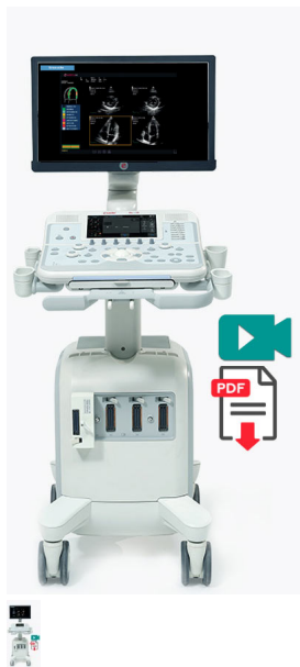
Esaote MyLab™X6: Außergewöhnlich flexible Ultraschallbildgebung