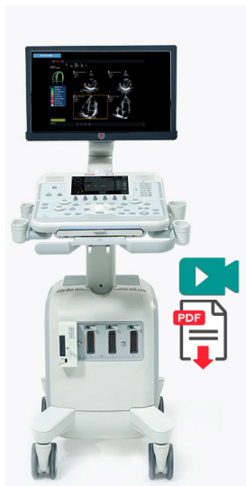
Esaote MyLab™X6: Außergewöhnlich flexible Ultraschallbildgebung